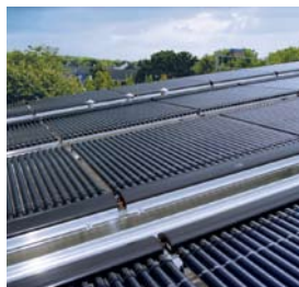
Vitosol 200-T położone bezpośrednio na dachu płaskim.

Vitosol 200-T jest wysokowydajnym kolektorem rurowym, który działa na zasadzie heatpipe i jest przeznaczony do montażu w dowolnym położeniu.