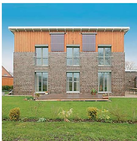
Kolektory słoneczne Vitosol 200-T powieszone pionowo na ścianie budynku.