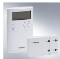
Vitotrol 100, typ UTDB-RF Bezprzewodowy termostat pomieszczenia