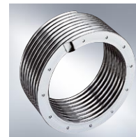
Powierzchnia grzewcza Inox-Radial z wysokojakościowej stali szlachetnej